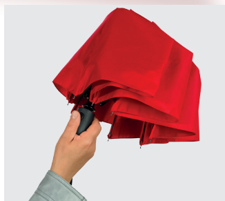
Step 1: press the button to open