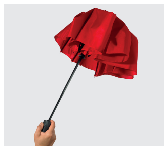
Step 3: press the button to close