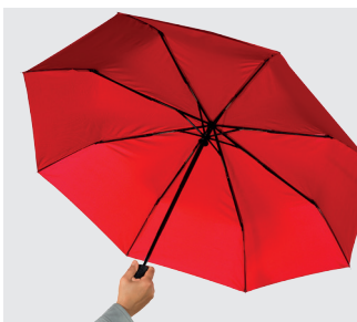
Step 2: umbrella is open