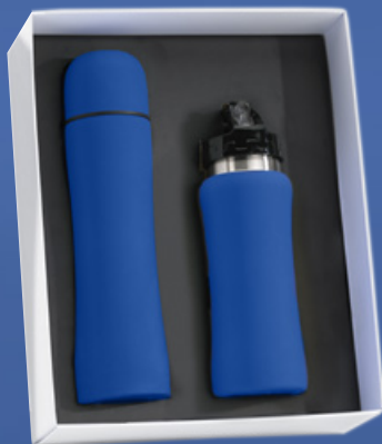
Zestaw do napojów: Termos, 500 ml. & Bidon, 600 ml. HT01/HB01