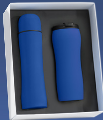
Zestaw do napojów: Kubek termiczny, 450 ml. & Termos, 500 ml. HD02/HT01