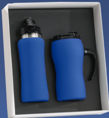
Zestaw do napojów: Bidon, 600 ml. & Kubek termiczny 450 ml. HB01/HD01