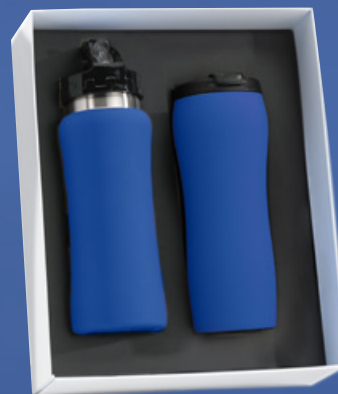
Zestaw do napojów: Bidon, 600 ml. & Kubek termiczny, 450 ml. HB01/HD02