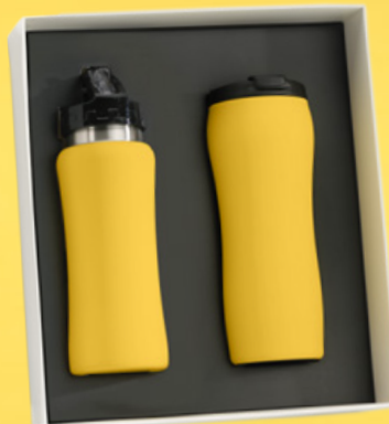
Zestaw do napojów: Bidon, 600 ml. & Kubek termiczny, 450 ml. HB01/HD02