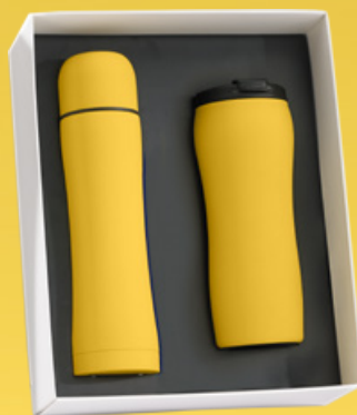
Zestaw do napojów: Kubek termiczny, 450 ml. & Termos, 500 ml. HD02/HT01