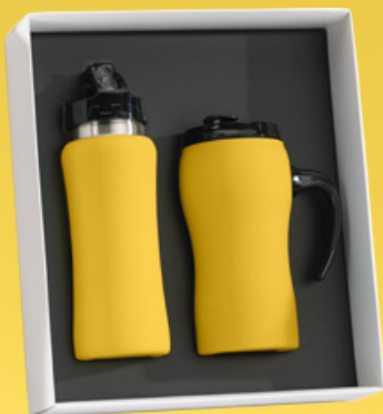
Zestaw do napojów: Bidon, 600 ml. & Kubek termiczny 450 ml. HB01/HD01