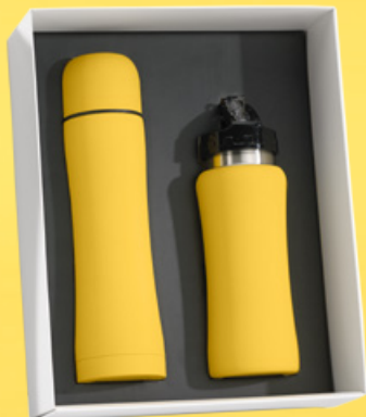
Zestaw do napojów: Termos, 500 ml. & Bidon, 600 ml. HT01/HB01