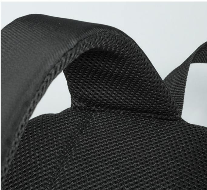
dos rembourré en mousse