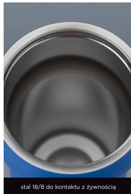
stal 18/8 do kontaktu z żywnością