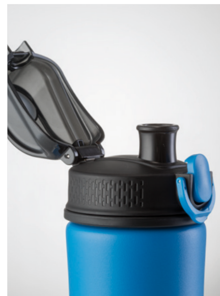
double verrouillage du bouchon