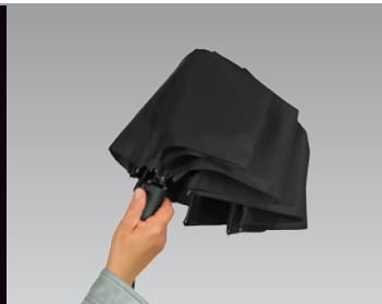
1. Drücken Sie die Taste zum Öffnen