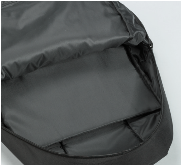
scomparto per laptop