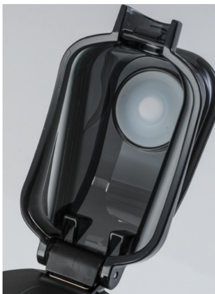
apertura con un clic