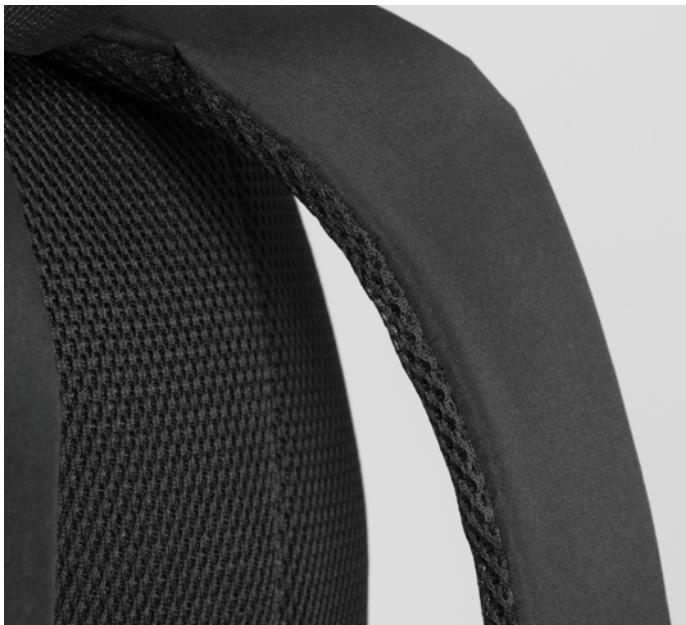
Supporto in PVC