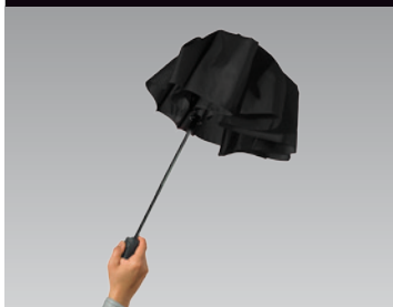
2. premere il pulsante per chiudere