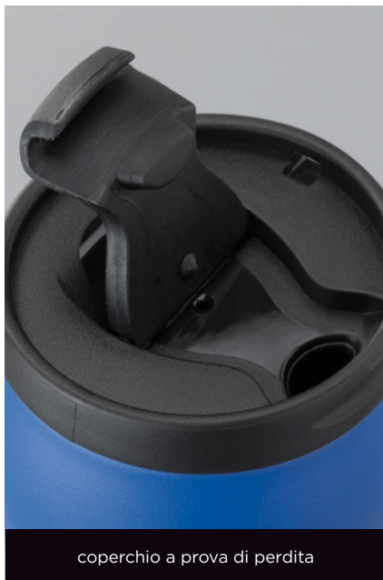
coperchio a prova di perdita