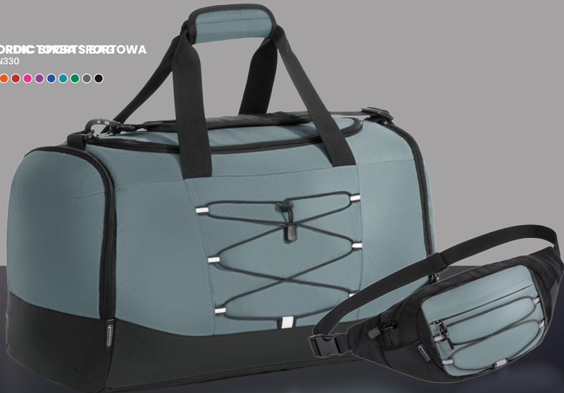
NORDIC SASZETKA NA PAS LNN340