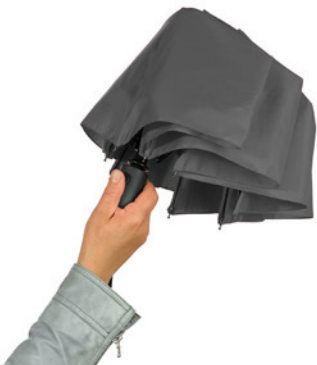
Step 1: press the button to open