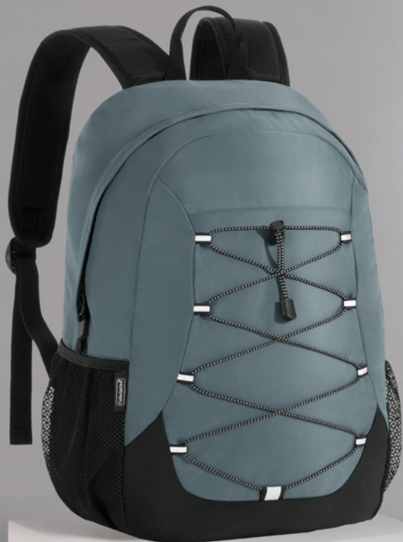
NORDIC PLECAK DWUKOMOROWY 15" LPN320