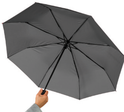
Step 2: umbrella is open