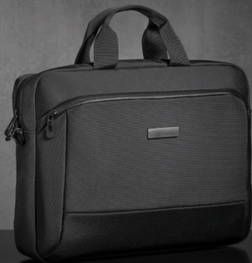
BIZZ PRO TORBA NA LAPTOPA JEDNOKOMOROWA 15" LLN420