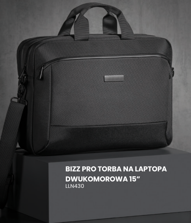
BIZZ PRO TORBA NA LAPTOPA DWUKOMOROWA 15" LLN430