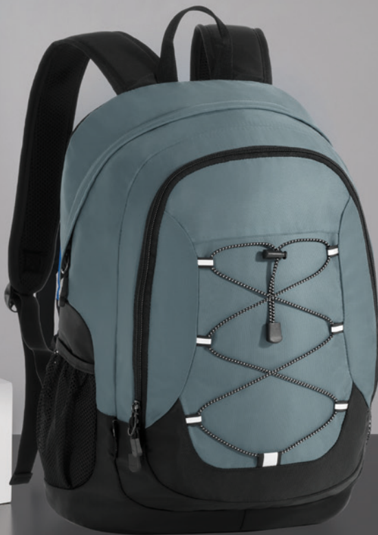
NORDIC PLECAK JEDNOKOMOROWY 15" LPN310