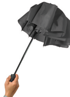
Step 3: press the button to close