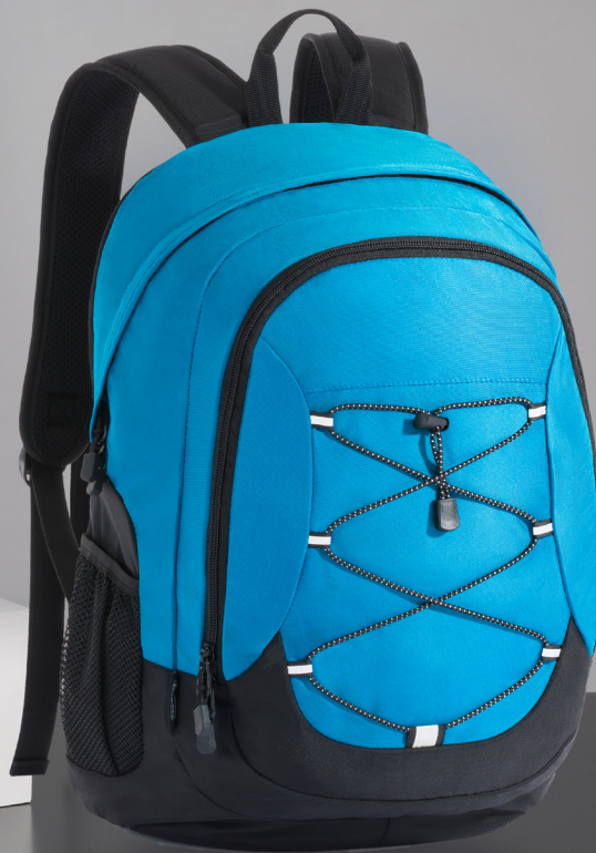
NORDIC PLECAK JEDNOKOMOROWY 15" LPN310