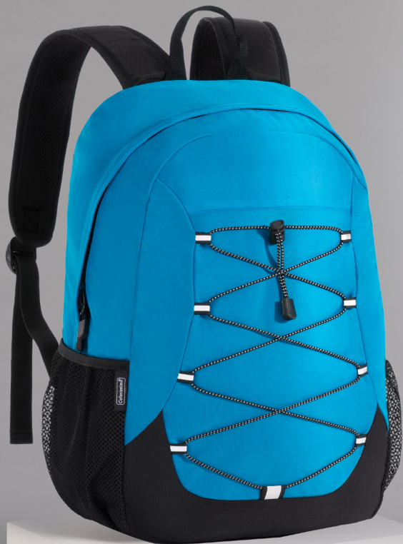
NORDIC PLECAK DWUKOMOROWY 15" LPN320